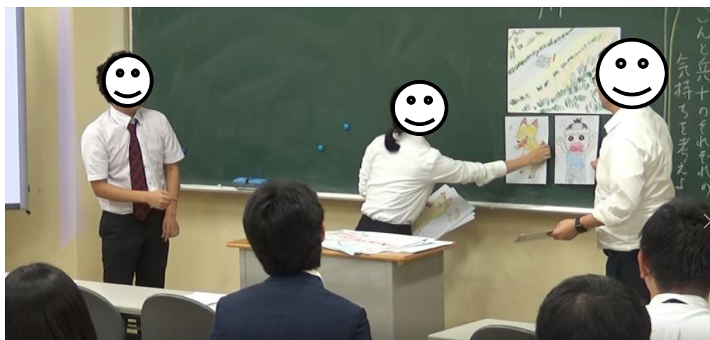
写真3 「模擬授業②」の授業風景

タイムラグの合計は73.2秒となり、約7分の授業時間のうちタイムラグが占める割合が約17%となり「模擬授業①」とほぼ同程度の値となった。「模擬授業②」のトランスクリプトを巻末の表3に示した。