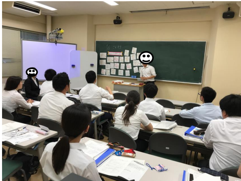
写真 2 「模擬授業①」の授業風景

また、タイムラグの合計は 94.32 秒となり、約 10 分の授業時間のうちタイムラグが占める割合が約 15% となり「授業体験と話し方」に比べ、値が小さくなった。「模擬授業①」のトランスクリプトを巻末の表 2 に示した。