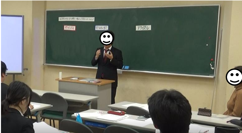
写真4 「模擬授業検定」の授業風景