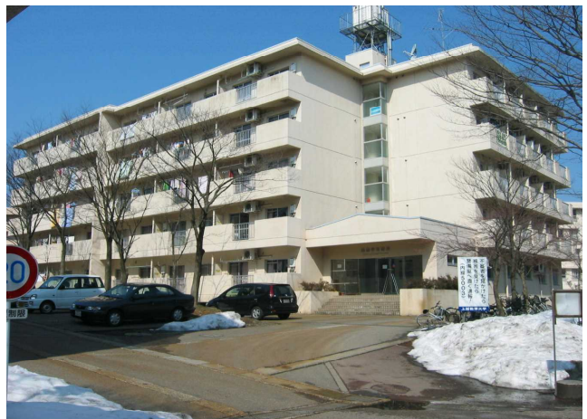
国際学生宿舎 国際学生宿舎